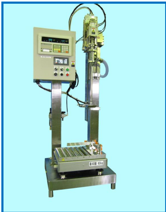
ロングノズル液面追随昇降式